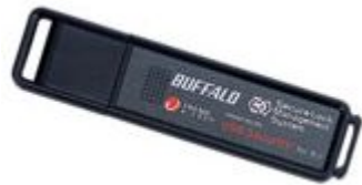
USB フラッシュメモリー

今回も「無料(フリー)ソフト」の紹介です。 先日、せっかくだいたった貴重なオールドタイムSDのコールの音楽ファイルを『USBメモリー』に入れてもらったのですが、この貴重なファイルを別のパソコンに移動する際に、整理する手順を誤り、削除してしまっていたのです。困りに困っていたのですが、インターネットで「フリーソフト」をいくつか試してみたのです。そうしたら、まったく開けなかった「削除ファイル」がまた、【開くことができた!】のです。すごい!の一言でした。